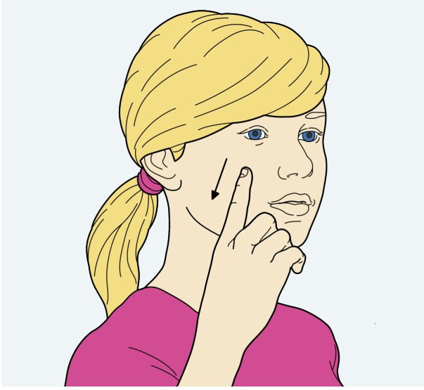
2. ایک انگلی کیساتھ اپنی گال کو تھپتھائیں۔